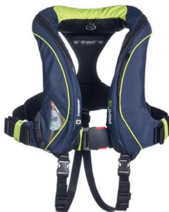
Crewsaver Ergofit 290